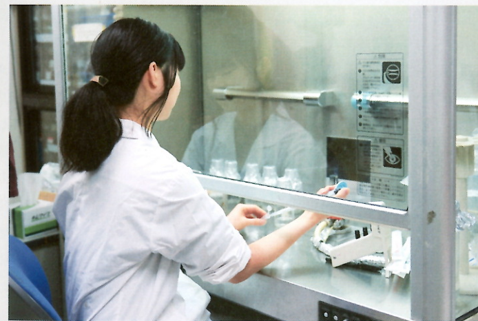
Fig.2——無菌環境で細胞培養の準備